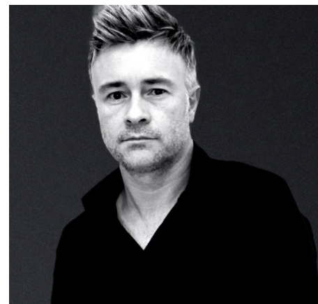
Salon Nicolas Goncalves Maison Beauté @nicolasgoncalveshairdresser

Ma préférée est le Bleu, cette couleur est une invitation aux voyages. Elle est là couleur du ciel, de la nuit, de l'océan et des lagons... Il apporte le calme, la confiance et la sérénité.